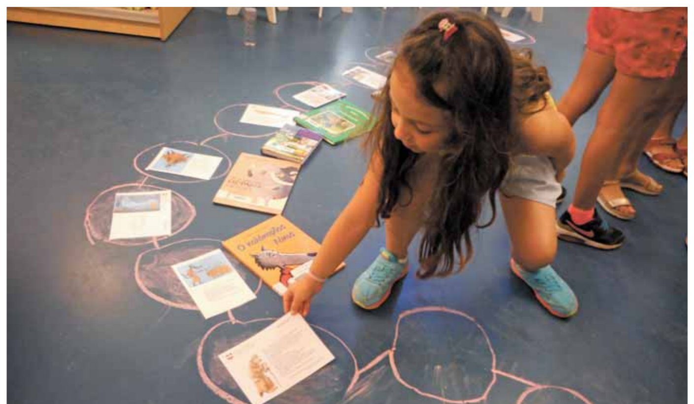
Διαδρομές από βιβλίο σε βιβλίο Παιδική Βιβλιοθήκη Συντονισμού Καραμπουρνάκι