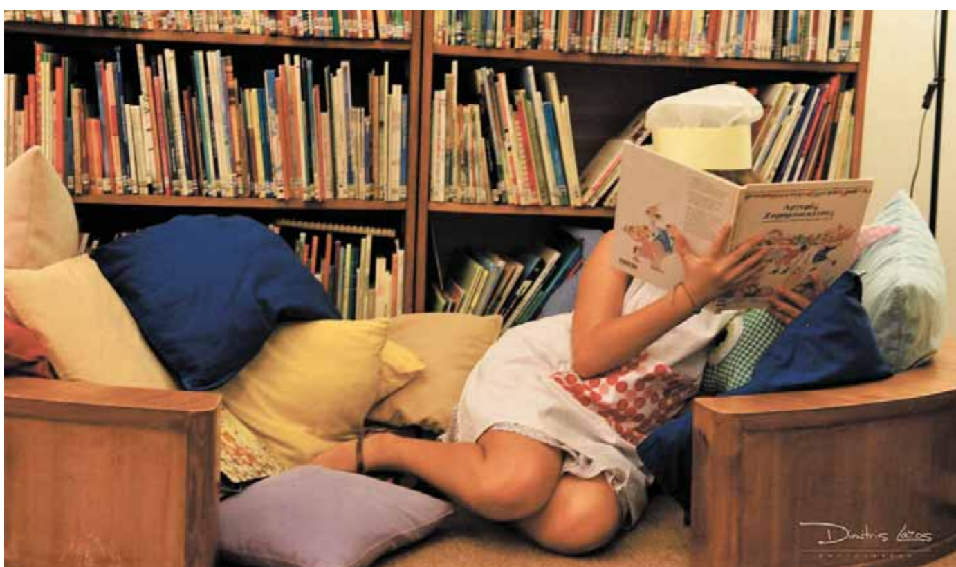
Παιδική Βιβλιοθήκη Κηφισιάς, Καλοκαιρινή εκστρατεία.

*Η Μαρία Φιλίω Τριδής είναι κοινωνιολόγος. Οι μεταναστευτικές πολιτικές, τα ζητήματα ένταξης και εκπαίδευσης μεταναστών αποτελούν μερικά από τα ενδιαφέροντά της. Έχει κάνει μεταπτυχιακές στα Ανθρώπινα Δικαιώματα, στην Ευρωπαϊκή Ένωση και Διεθνείς Σχέσεις και την Εκπαιδευτική Πολιτική στα Πανεπιστήμια Warwick (Ηνωμένο Βασίλειο) και Αθηνών (ΕΚΠΑ, Ελλάδα). Είναι υπεύθυνη για το σχεδιασμό ή την υλοποίηση του εκπαιδευτικού προγράμματος «Μελέθουρν — Αθήνα: Μια διαδρομή Φιλίας» το οποίο πραγματοποιήθηκε από τα Σχολεία Γλώσσας και Πολιτισμού της Ελληνικής Κοινότητας Μεμβούρνς σε συνεργασία με το Ελληνοαμερικανικό Εκπαιδευτικό Ίδρυμα (Κολλέγιο Ψυχικού, Αθήνα). Έχει εργαστεί ως εκπαιδευτικός κοινωνιολογίας και ως υπεύθυνη συντονισμού, πρωτοβουλιών χρηματοδοτούμενων από την Ευρωπαϊκή Ένωση για την ειδική αγωγή και την ένταξη των ατόμων με αναπηρία.